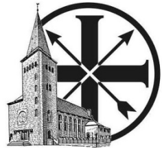
St. Antonius Schützenbruderschaft