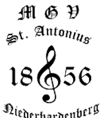
MGV St. Antonius