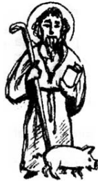
Pfarrgemeinderat St. Gertrud Ortsausschuss St. Antonius